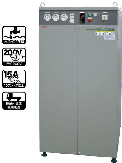
CHV-3750W ※外観は変わる場合があります。

インバーター冷凍機採用のCHVシリーズは省エネかつ高精度。水冷式一体型のベースモデル、ご要望に応じてカスタマイズ致します。